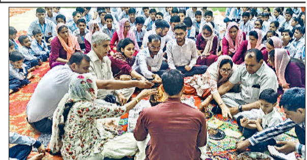
जयंती अवसर पर आयोजित हवन में आहुति डालते हुए ।