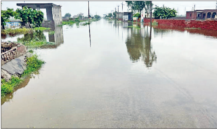
भिवानी। गांव प्रेमनगर के मुख्य मार्ग पर जमा बारिश का पानी।