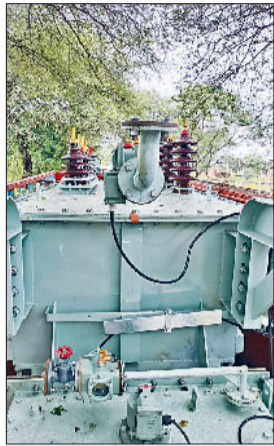
बाढ़ड़ा। काकड़ौली सरदारा में पहुंचा ट्रांसफार्मर।

एक साल से आंदोलनरत क्षेत्र के कृषि व घरेलू उपभोक्ताओं में खुशी की लहर