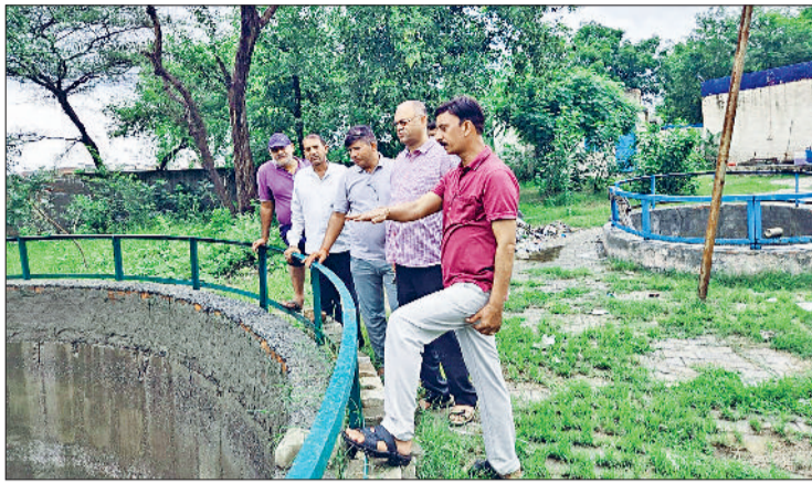
भिवानी। शहर स्थित डिस्पोजल का निरीक्षण करते अधीक्षण अभियंता।।