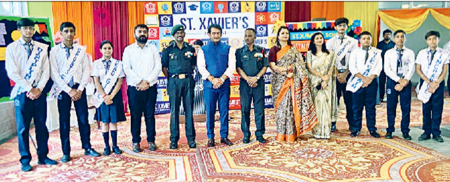
भिवानी। कार्यक्रम में उपस्थित बच्चे व शिक्षक ।

विभिन्न छात्र पदों जैसे हेड बॉय, हेड गर्ल, हाउस कैप्टन आदि पर नियुक्त करने के लिए आयोजित किया जाता है। कार्यक्रम में मुख्यअतिथि के रूप में एनसीसी