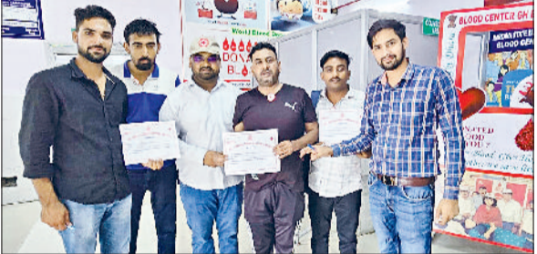
भिवानी। रक्तदाताओं को बेज लगाकर सम्मानित करते हुए।