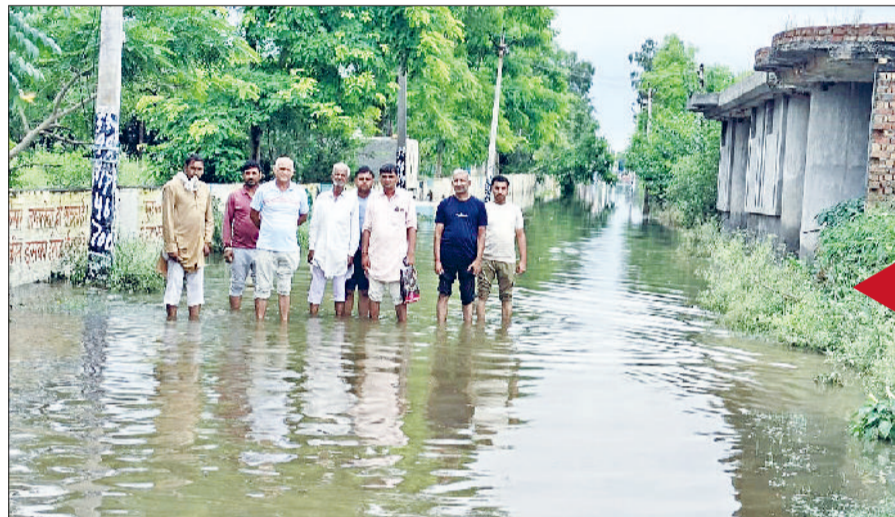
भिवानी। गांव बीरण की गलियों में जमा पानी दिखाते हुए।

दूसरी तरफ इतनी ही बारिश देहात में भी हुई, लेकिन वहां पर पानी की निकासी सही ढंग से न होने की वजह से रिहायशी कॉलोनी डूबने लगी है। हालात ये बने हैं कि भिवानी के आसपास व बवानीखेड़ा के गांवों में जबरदस्त बारिश ने बाहरी कॉलोनीयों के घरों में पानी जमा हो गया। अगर थोड़ी सी भी बारिश और हुई तो ग्रामीण इलाकों से लोगों का पलायन होना शुरू हो