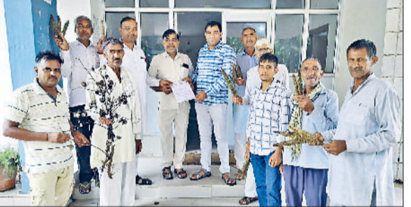
बाढ़ड़ा। किसानों की समस्याओं को लेकर ज्ञापन सौंपते हुए।